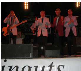
Un momento del concierto del pasado día 11 de junio.